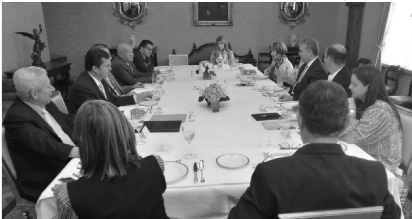
Reunión del presidente Ivan Duque con las Centrales el día 05 de septiembre.