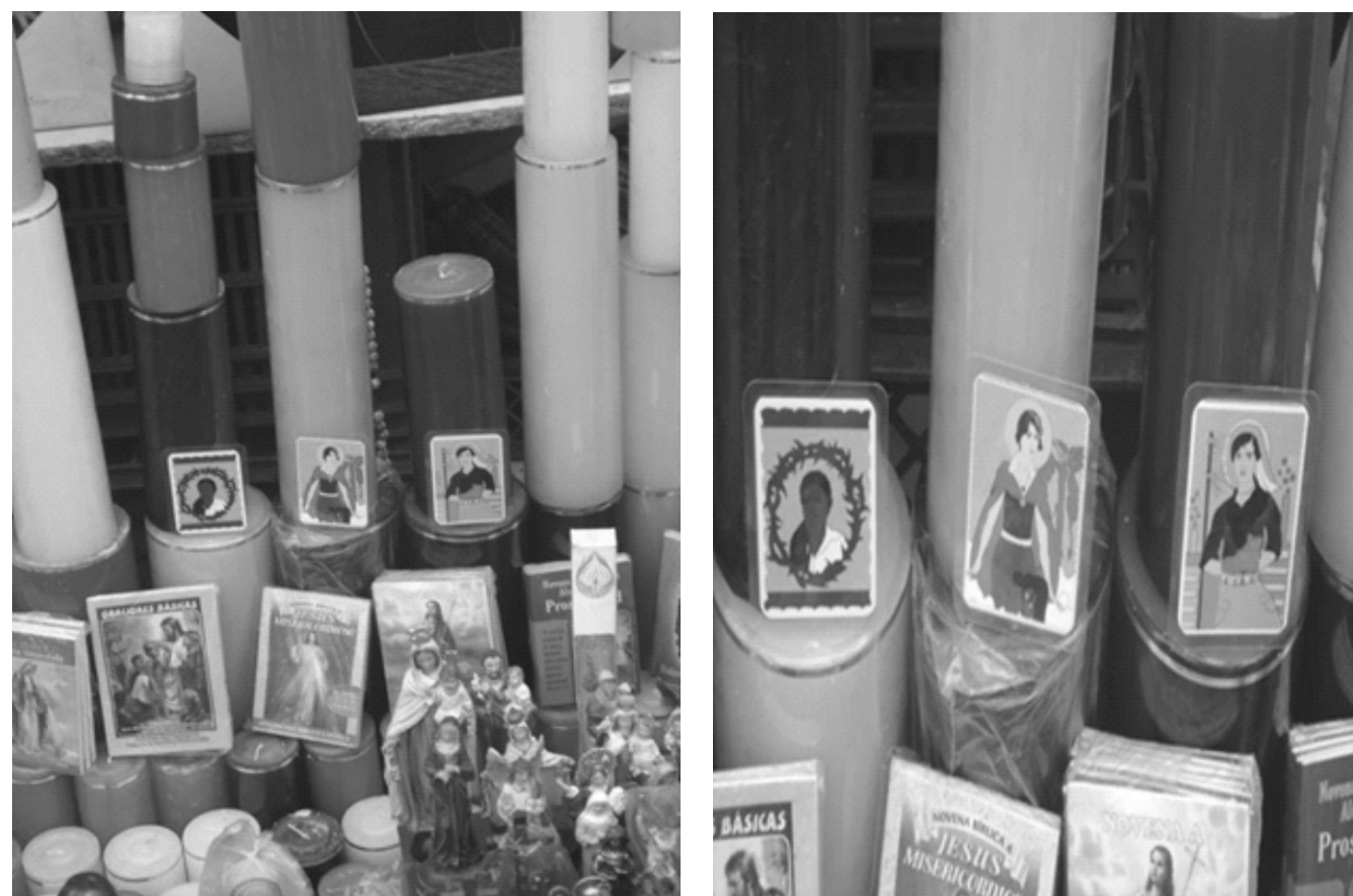
Estampitas de las santas