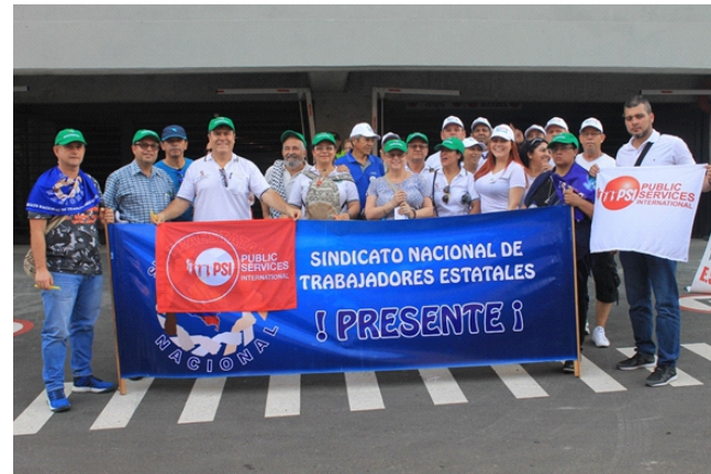
Miembros de SINTRAESTATALES NACIONAL y de las Subdirectivas de Bello y la Estrella, así como de SINTRABELLOSALUD, que marcharon este primero de mayo por las calles del Municipio de Bello.