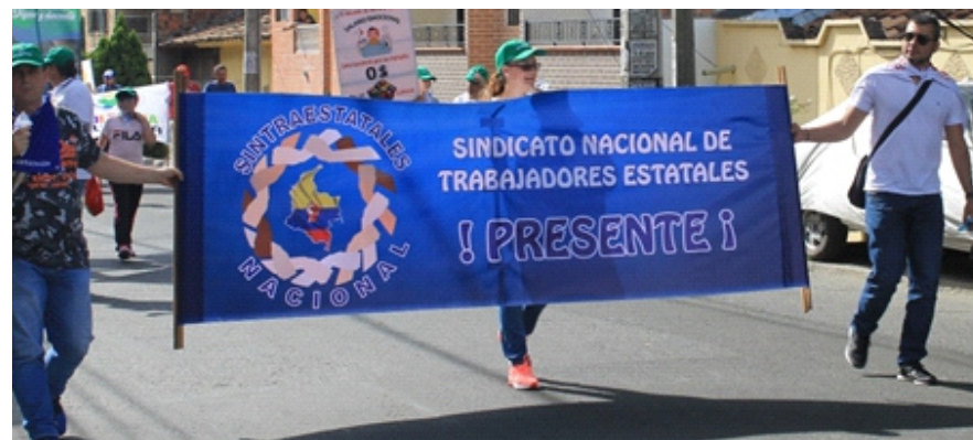
Los compañeros SINTRAESTATALES de la Subdirectiva La Estrella, en marcha por las calles bellanitas