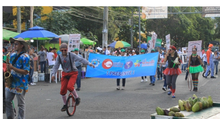
Primero de Mayo en el Municipio de Bello, ¡¡Toda una fiesta por la vida!!