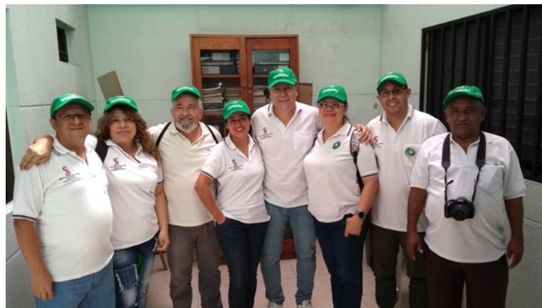
Algunos de los miembros de la Subdirectiva de SINTRAESTATALES Bello, junto a algunos afiliados de base, preparándose para su participación en la jornada del primero de mayo.