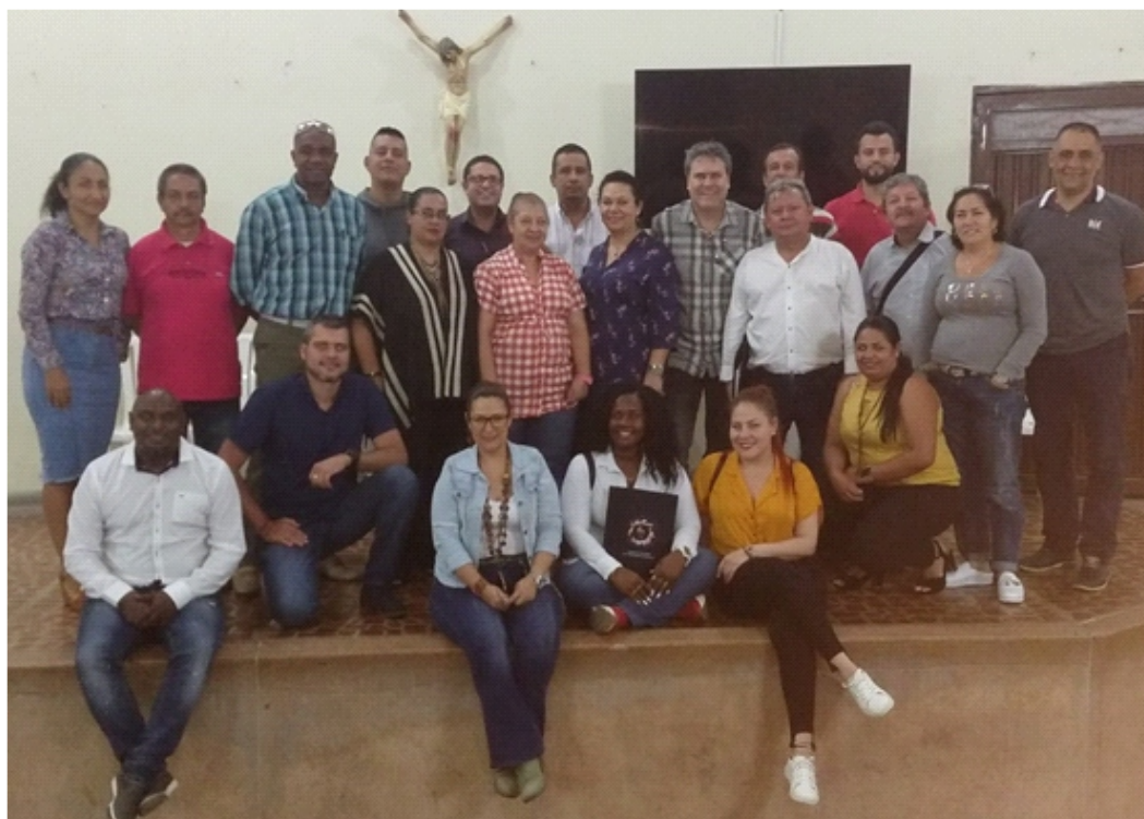
Algunos de los Delegados Nacionales y miembros de la Junta Directiva Nacional asistentes a la Asamblea Nacional.

A la reunión asistieron, además de los dignatarios de la Junta Directiva Nacional, los Delegados Nacionales en representación de las Subdirectivas de Bello, La Estrella, Itagüí, Turbo, Honda y de Sintrabellosalud, así como otros de nuestros afiliados en calidad de invitados.