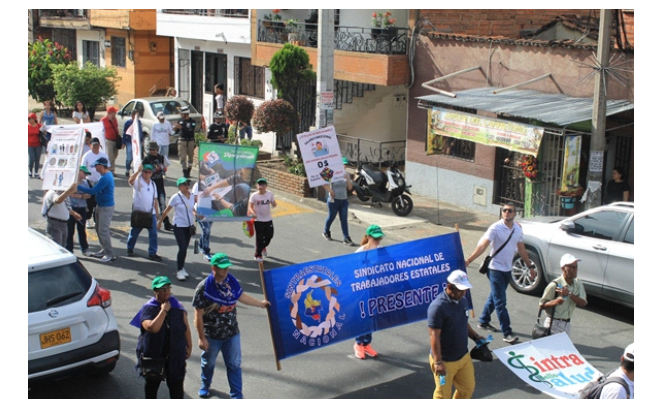
Grupo de marchantes, SINTRABELLOSALUD presente