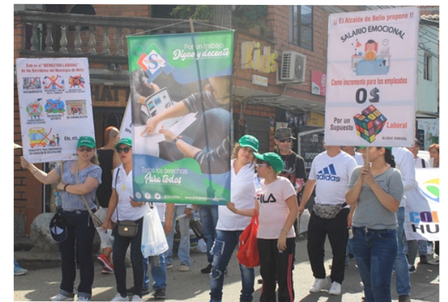
Compañeras de la Subdirectiva Bello, marchando el primero de mayo por un trabajo digno y decente para todos.