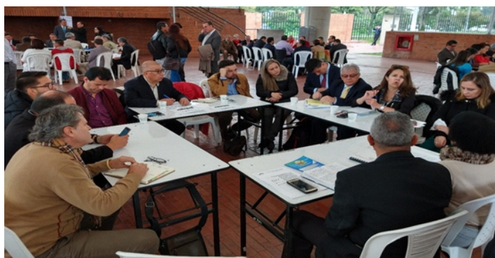
Panorámica de algunas de las Mesas Sectoriales en la Negociación Nacional, en primer plano la Mesa Sectorial en donde se discutieron los temas relacionados Gobierno-Territoriales.