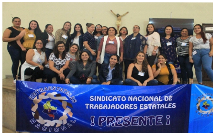
Grupo de Mujeres de Sintraestatales Nacional asistentes al primer encuentro Nacional de Jóvenes y Mujeres.