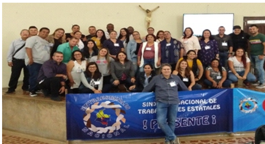
Grupo general de participantes en el Primer Encuentro Nacional de Jóvenes y Mujeres de SINTRAESTATALES NACIONAL.