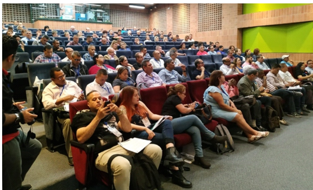
Panorámica general de los asistentes al Primer Encuentro Regional Antioquia-Eje Cafetero de Servidores Públicos de la Internacional de Servicios Públicos, realizado en el Auditorio del IDEA, en la ciudad de Medellín.

En ese sentido los lemas centrales del encuentro fueron: ¡¡PORQUE NECESITAMOS FORTALECER LA NEGOCIACIÓN COLECTIVA EN EL NIVEL TERRITORIAL!! y ¡¡PORQUE LA CONSTRUCCIÓN DE LA PAZ ESTABLE Y DURADERA ES RESPONSABILIDAD DE TODOS/AS!!