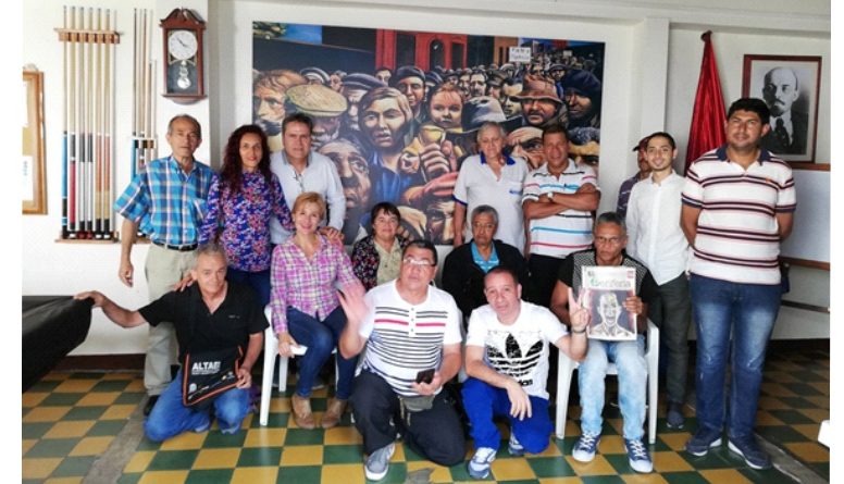
Algunos de los integrantes del Comité Pro-primero de Mayo en el Municipio de Bello, en la sede de SINTRATEXTEL, después de una de las múltiples reuniones preparatorias de la marcha.

Veamos seguidamente un registro gráfico de la participación de SINTRAESTATALES en la conmemoración del primero de mayo realizada este año en el Municipio de Bello: