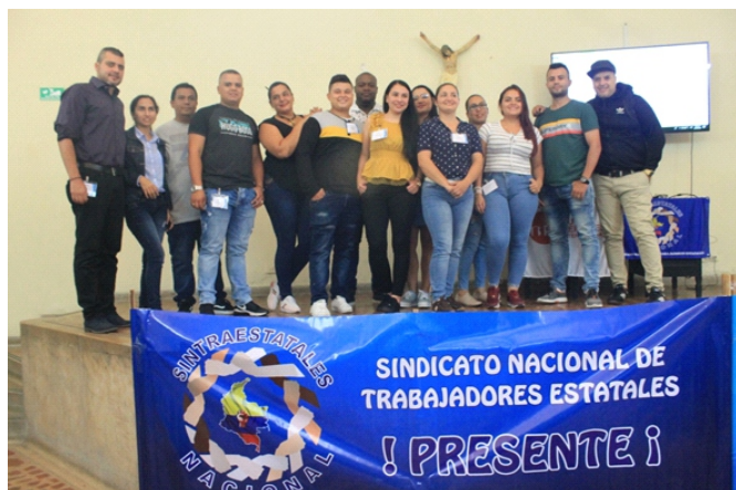
Grupo de Jóvenes de Sintraestatales Nacional asistentes al primer encuentro Nacional de Jóvenes y Mujeres.

De otro lado, otros objetivos ya más específicos que se abordaron en el encuentro, que fue todo un éxito, fueron: La recolección de información actualizada frente a la situación de los jóvenes y las mujeres en las diferentes subdirectivas de nuestra organización; la socialización del Plan de Acción Subregional de la ISP para los temas de Jóvenes y Mujeres, además de establecer mecanismos de participación y de adopción de sus lineamientos en las diferentes subdirectivas; finalmente, la consolidación de los Comité de Jóvenes y de Mujeres de SINTRAESTATALES NACIONAL con el fin de trabajar los lineamientos de los planes de acción de la ISP.