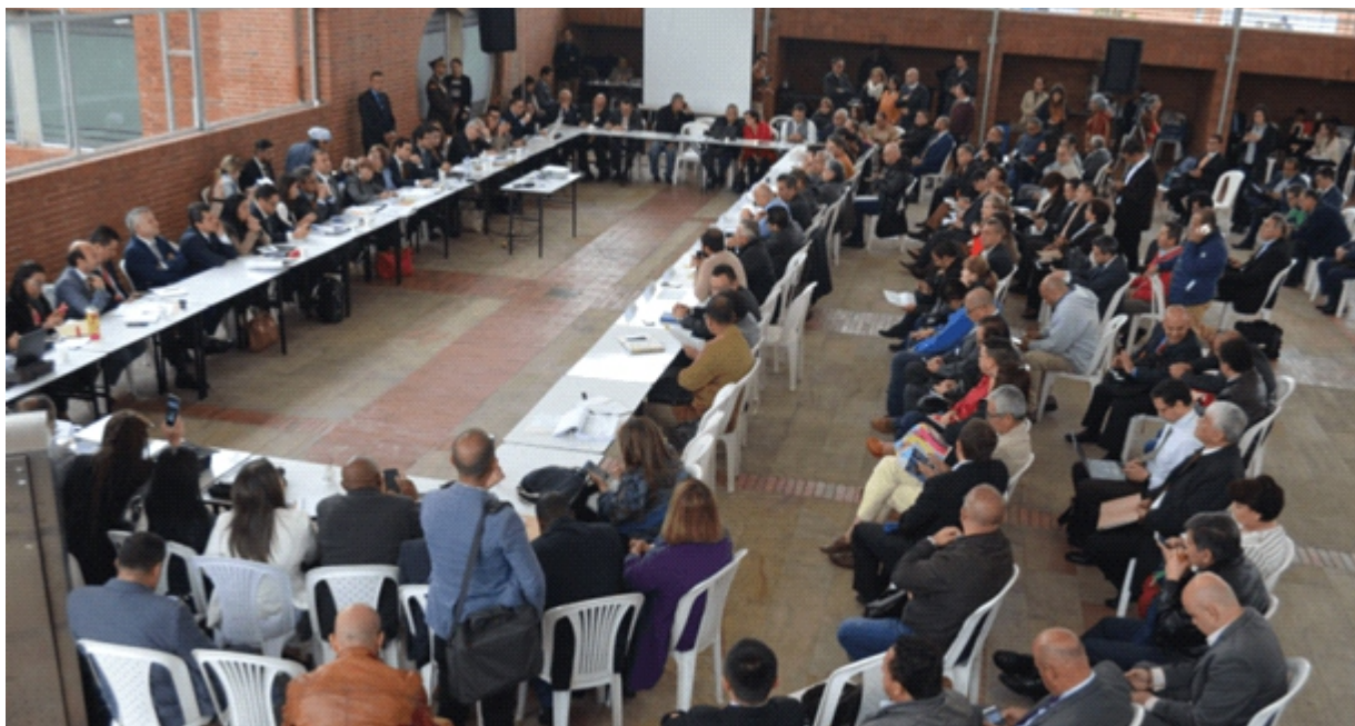
Panorámica de la Mesa Central de la Negociación de los Estatales con el Gobierno Nacional.

Entre el 11 de marzo y el 23 de mayo se llevó a cabo la negociación colectiva entre las centrales sindicales y las federaciones del sector estatal con el Gobierno Duque.